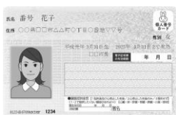
マイナンバーカード