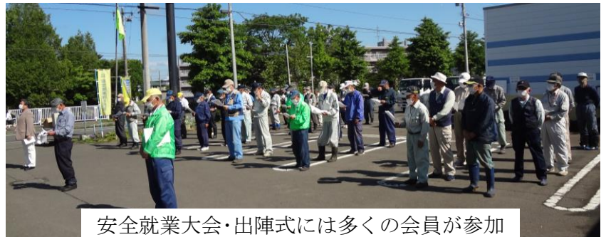
安全就業大会・出陣式には多くの会員が参加