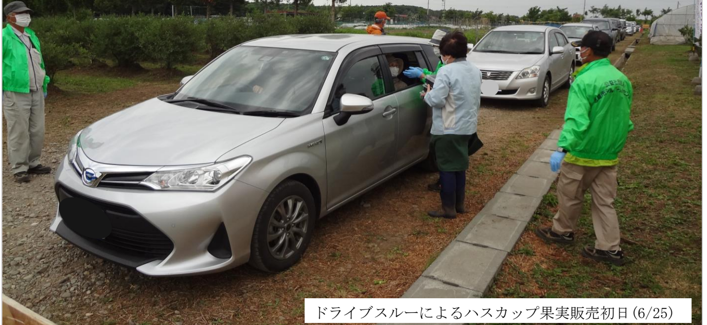
ドライブスルーによるハスカップ果実販売初日(6/25)