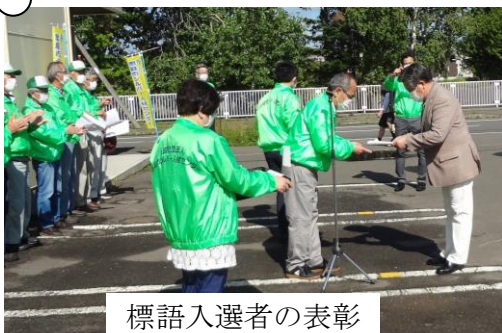
標語入選者の表彰