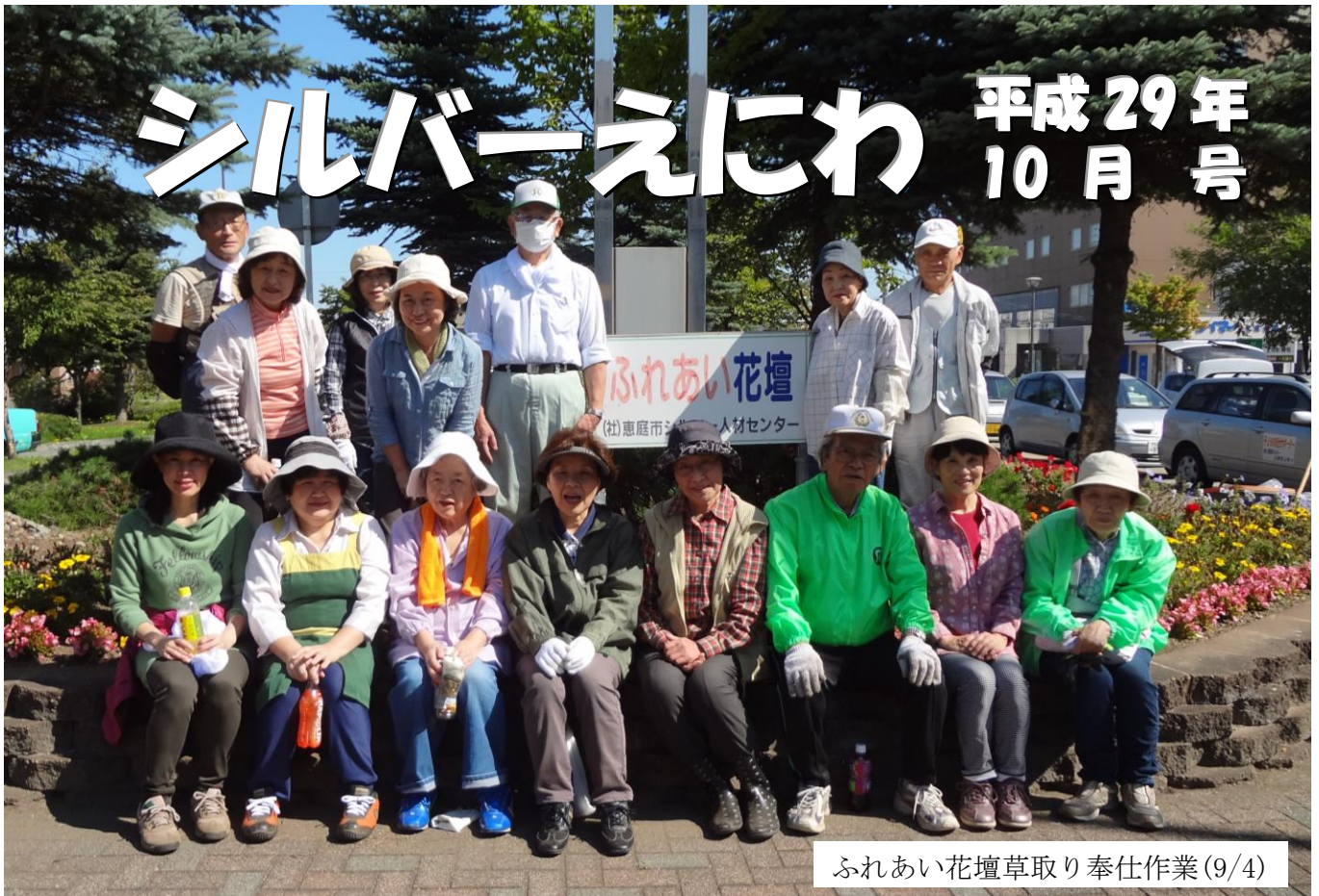
ふれあい花壇草取り奉仕作業(9/4)