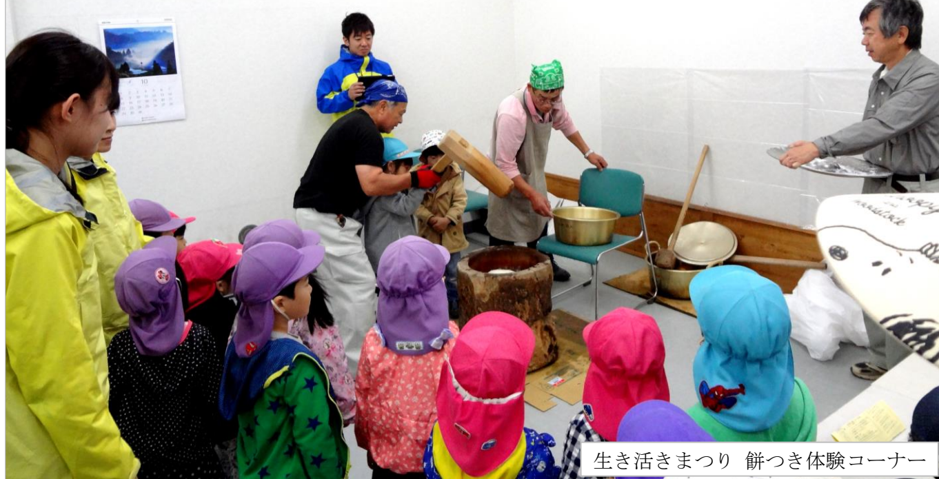
生き活きまつり 餅つき体験コーナー