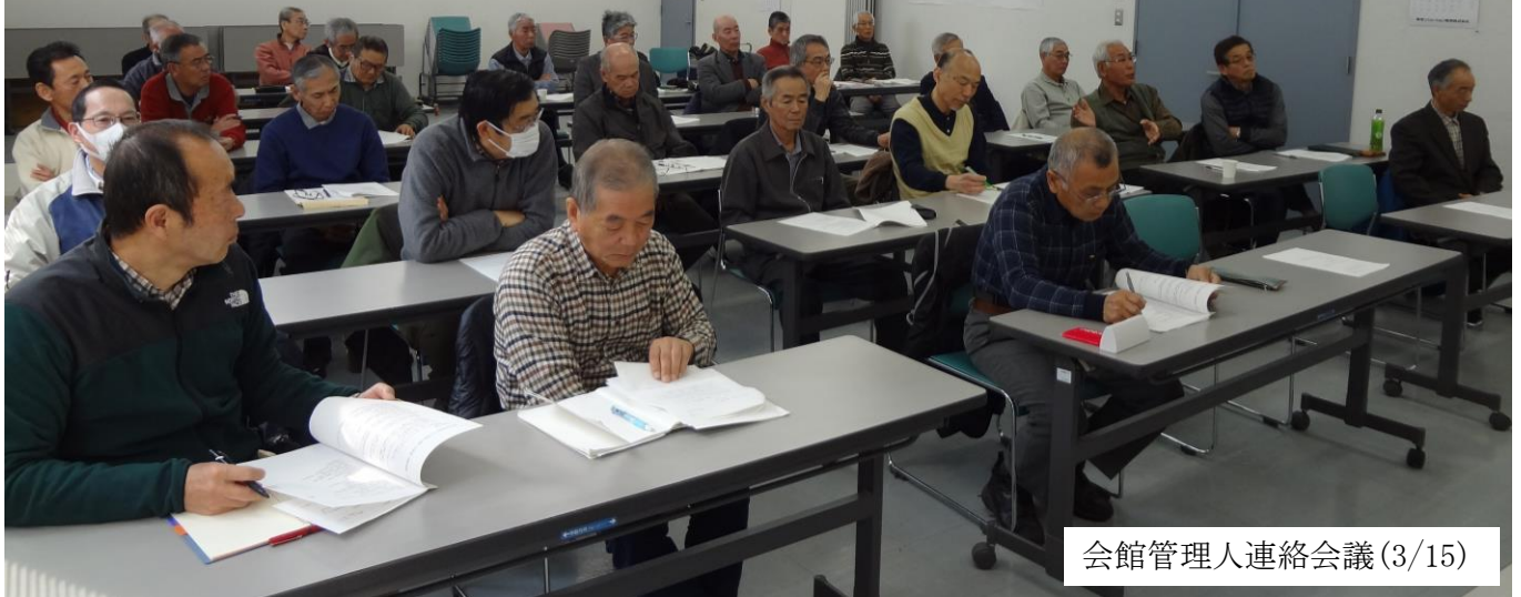
会館管理人連絡会議(3/15)