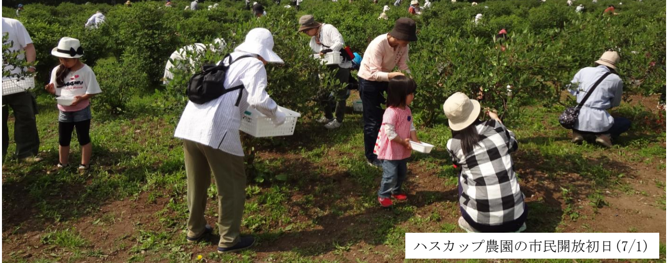
ハスカップ農園の市民開放初日(7/1)