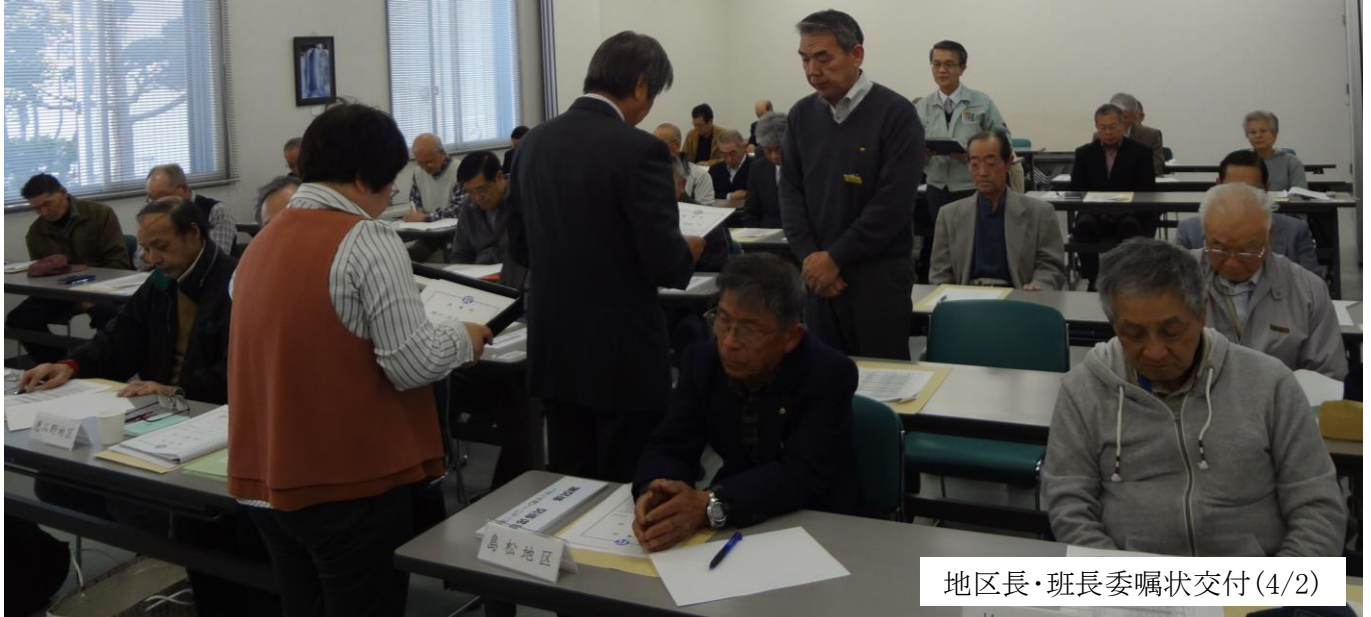
地区長・班長委嘱状交付(4/2)