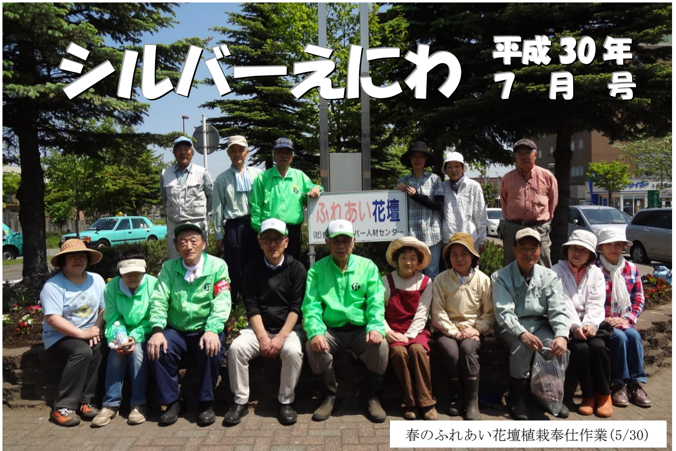
春のふれあい花壇植栽奉仕作業(5/30)