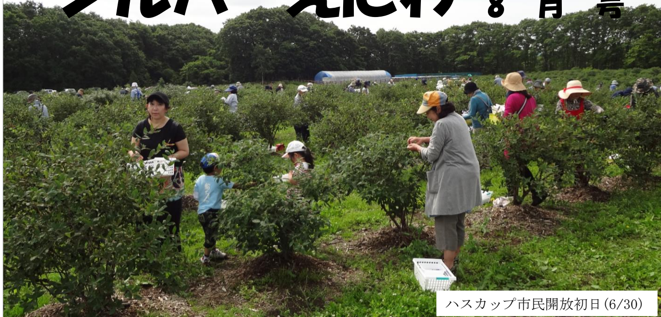
ハスカップ市民開放初日(6/30)