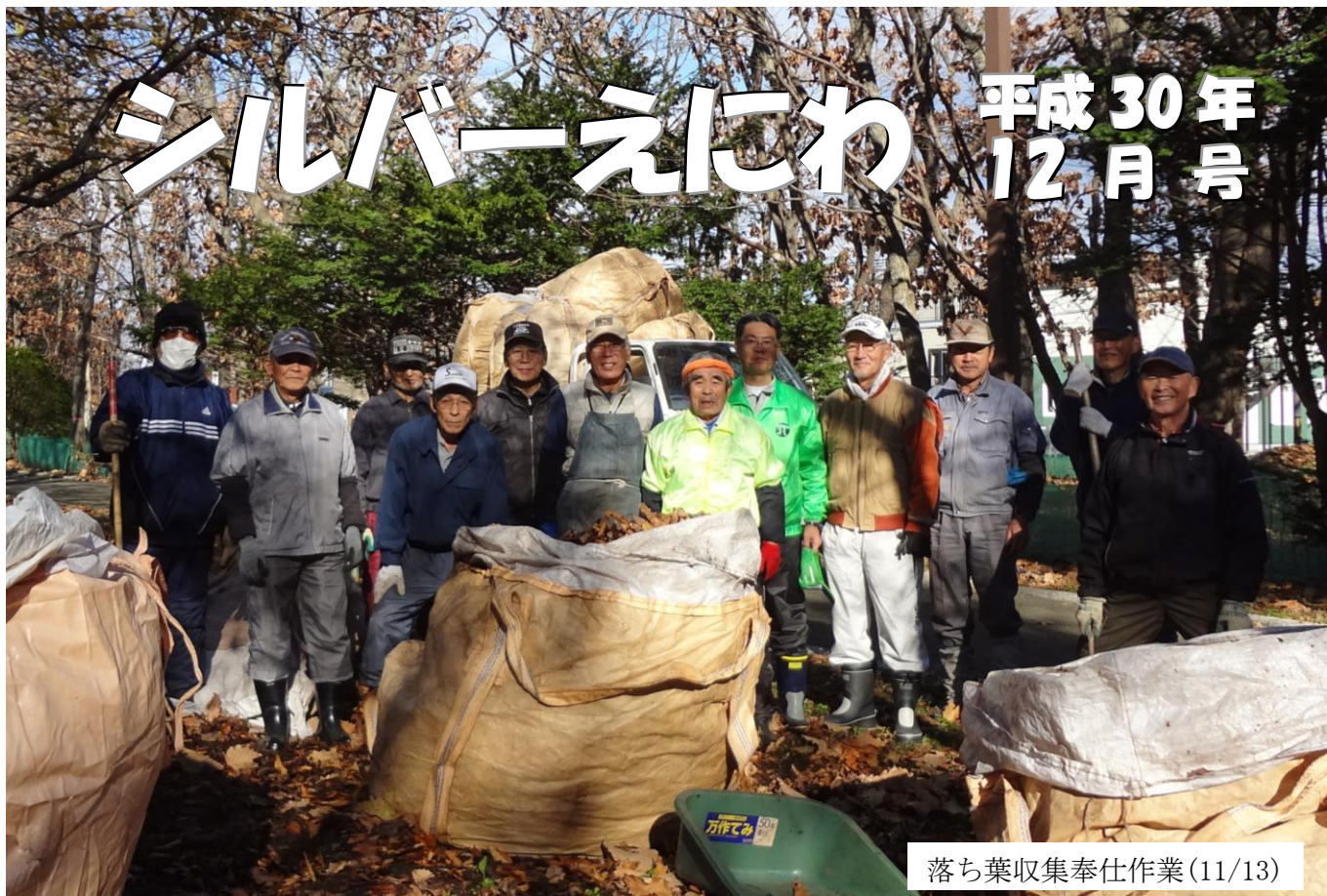
落ち葉収集奉仕作業(11/13)