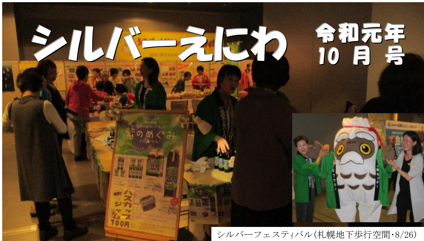
シルバーフェスティバル(札幌地下歩行空間・8/26)