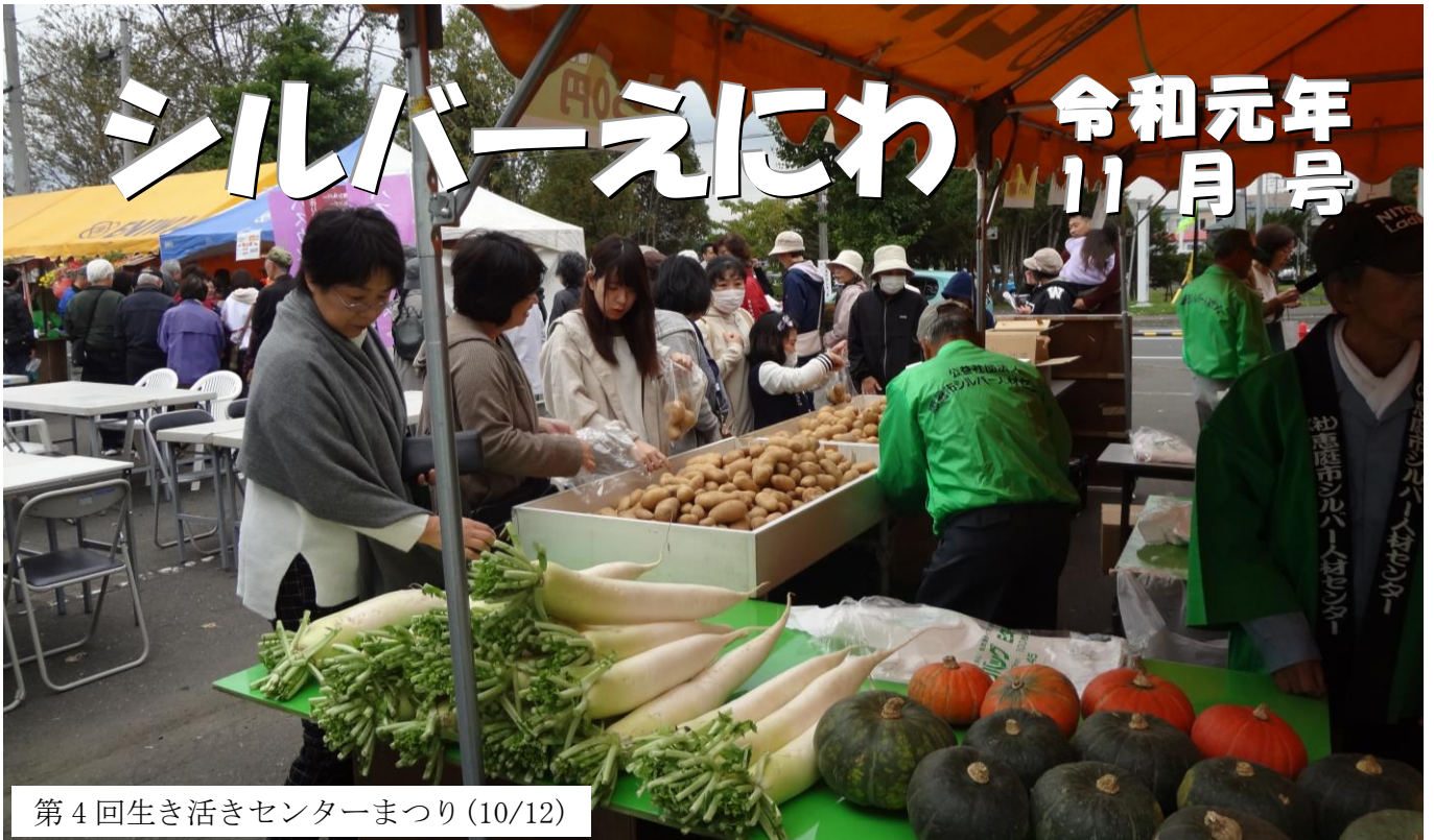
第4回生き活きセンターまつり(10/12)