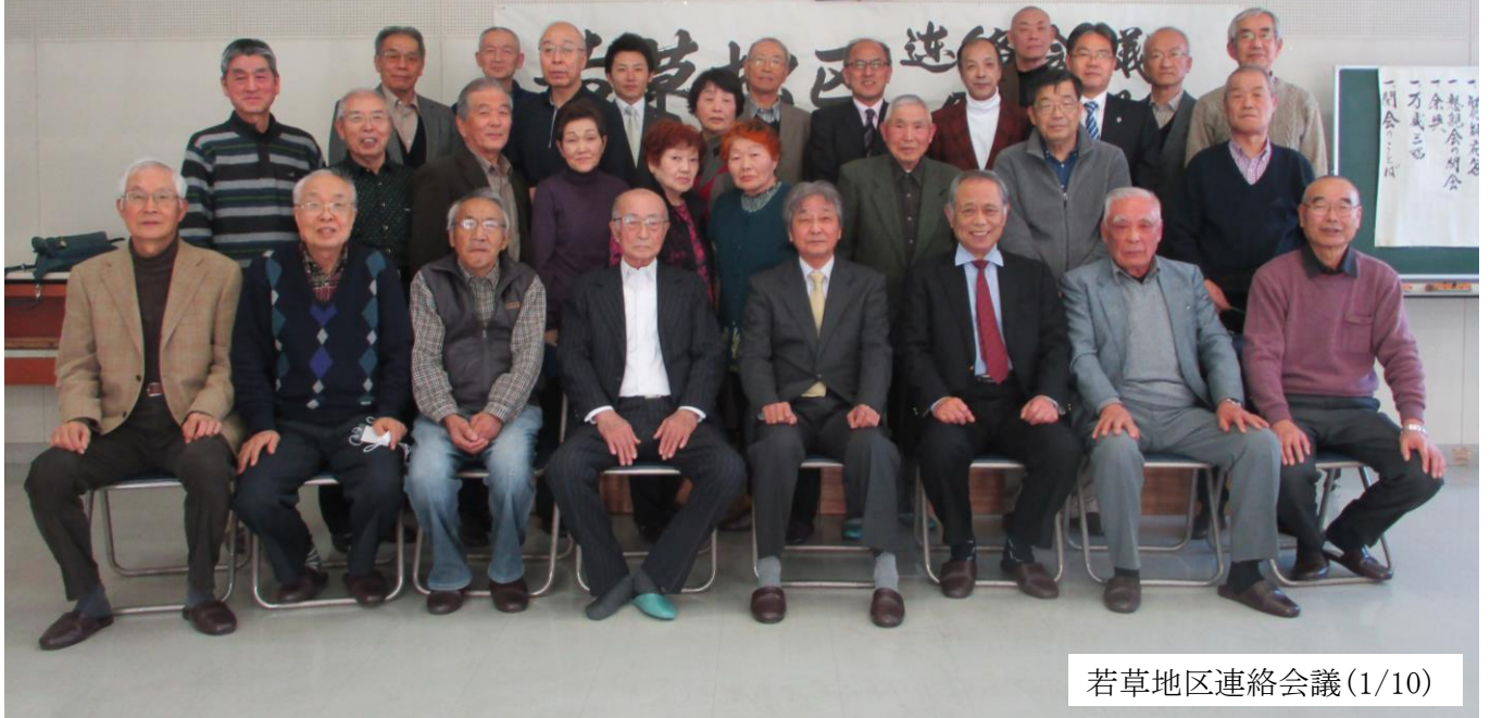
若草地区連絡会議(1/10)