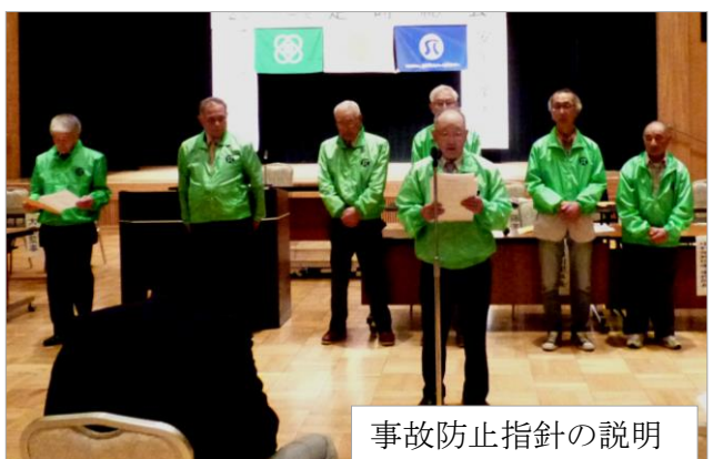
事故防止指針の説明