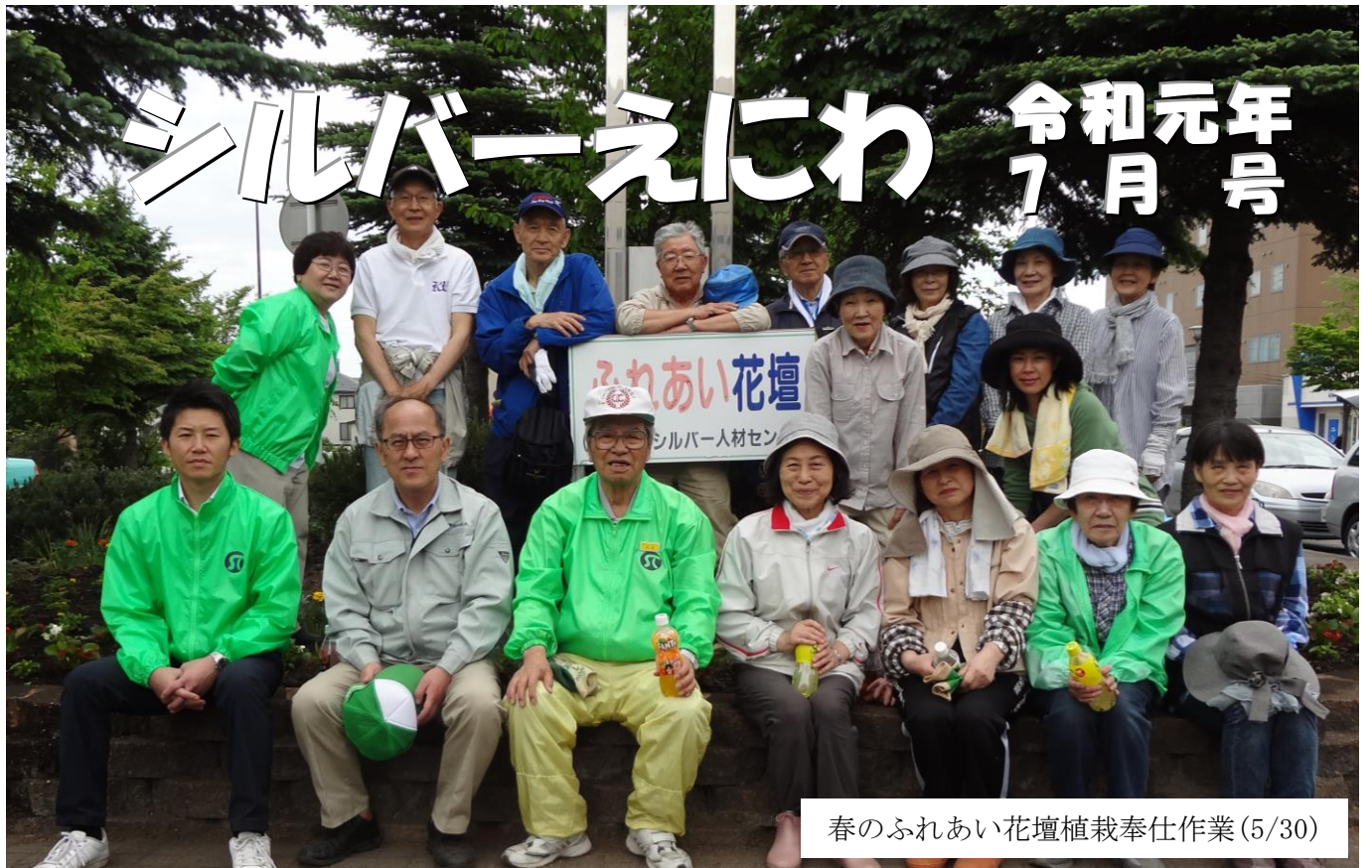
春のふれあい花壇植栽奉仕作業(5/30)